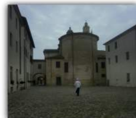
Alma scuola di alta cucina