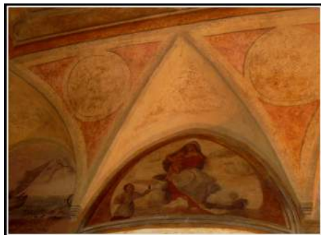
Madonna col bambino. Sala Rangoni

Alle ore 10:00 circa ritrovo con partenza per trasferimento in pullman, con le biciclette al seguito, presso l' area nautica di Torricella di Sissa