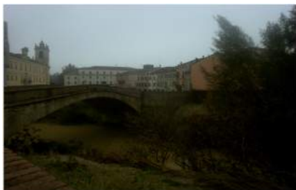
La Reggia e p.za Garibaldi

Si pedala verso Colorno, sulla strada per Torrile (SP 9); sulla ns. sx si vede il Mulino sul Galasso e la Torre delle Acque che aggiriamo e all'incrocio con via dei Mille (ciclopedonale) si gira a dx imboccandola. Si costeggia per un tratto il torrente Parma, all'incrocio con p. le Chevè si gira a dx e, pedalando sul ponte gobbo che scavalla "la Parma" (qui i corsi d'acqua sono al femminile), si giunge in Piazza Garibaldi su cui si affaccia l'elegante Reggia di Colorno. Una Reggia sontuosa, definita la Versailles dei Duchi di Parma, residenza dei Farnese e di Maria Luigia d'Austria, moglie di Napoleone.