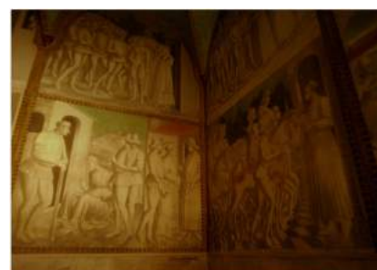
La “Sala di Griselda”